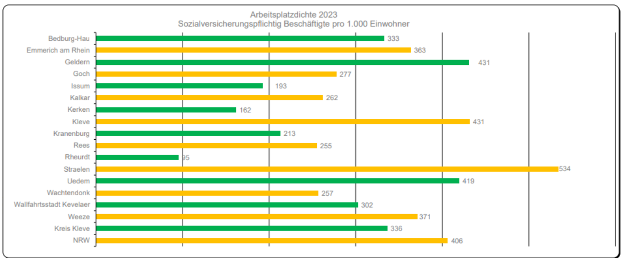
Tab. 11 : Arbeitsplatzdichte 2023 in den Städten und Gemeinden des Kreises Kleve

Interessant ist auf jeden Fall auch der Blick auf die geringfügig entlohnt Beschäftigten nach Arbeits- und Wohnort im Kreis Kleve. Im Verhältnis zur Einwohnerzahl ist die Zahl in Straelen relativ hoch, was sicherlich zu einem großen Teil am starken Agrobusinesssektor und dem Bedarf dieser Branche liegt.