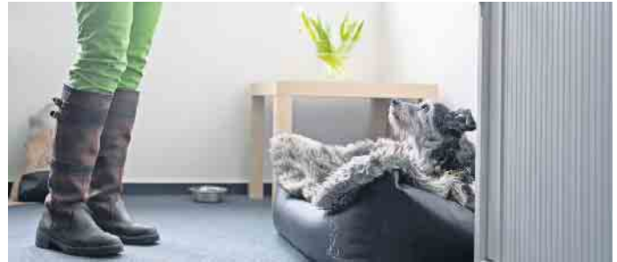
Kollege auf vier Pfoten: Hunde im Büro werden von vielen Unternehmen akzeptiert. Wichtig sind jedoch klare Regeln.

Wirkung zeigt sich in vielfacher Hinsicht, ob bei „Social Walks“ in der Mittagspause oder mit der guten Stimmung, die ein Hund verbreitet, wenn er morgens freudig mit wedelndem Schwanz zur Arbeit kommt. (DJD)