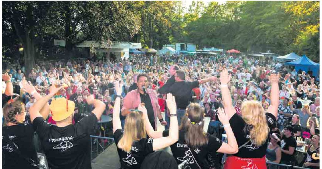
Beste Stimmung im vergangenen Jahr.

Bilder aus dem vergangenen Jahr, Eintrittskarten und weitere Infos gibt es unter www.gkg-narrenschiff.de oder in Straelen bei der Agentur Landeier, Klosterstraße 13.