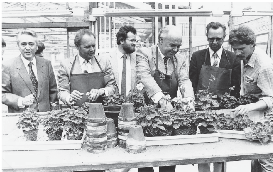
F1, 1283: Bildrechte: Stadtarchiv

zählen neben Nachrichten und Dokumenten selbstverständlich auch Fotos aus ganz Straelen und Herongen.