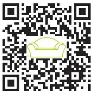
QR Code zur Anmeldung

Anmeldungen sind ab sofort telefonisch unter 02834 702-214 oder über den Ticketshop der Stadt Straelen auf der Seite: https://www.straelen.de/frei-zeit-tourismus/veranstaltungen/highlights-events/stadt-fest-stroelse-soomer/ möglich.