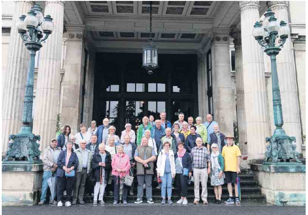
Ein Teil der Ausflügler vor der Villa Hügel