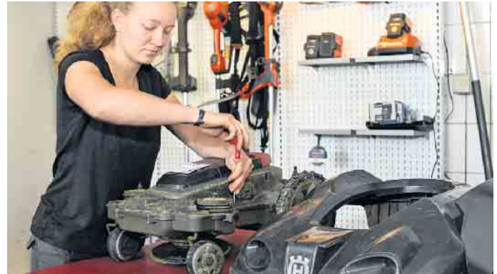
Bei mechatronischen Berufen stehen Wartung und Reparatur von Garten- und Outdoorgeräten im Mittelpunkt.

Branche nicht halt und sorgt für neue Herausforderungen, gerade für die junge Generation. (DJD)