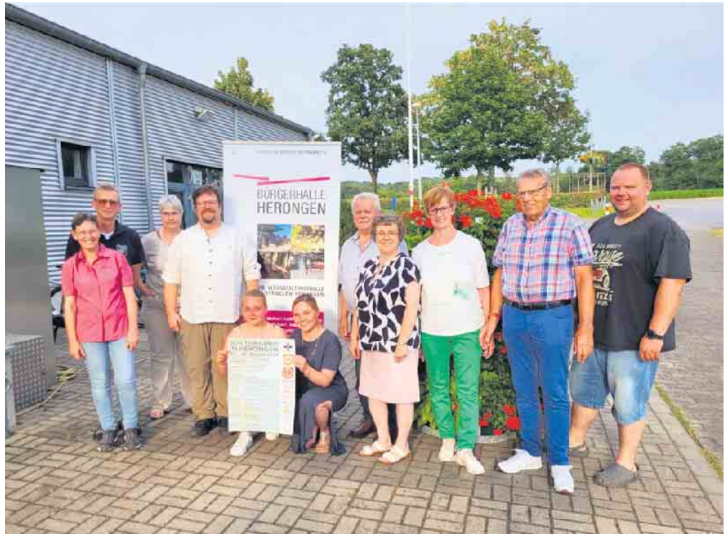
Vorstand Muttergottes Bruderschaft Herongen

Der Festzug mit Parade und Fahenschwenken an der Niederdorfer Straße findet am Sonntag, 25. August, um 15 Uhr statt. Ab 16 Uhr geht es mit dem Familiennachmittag am Festplatz weiter.