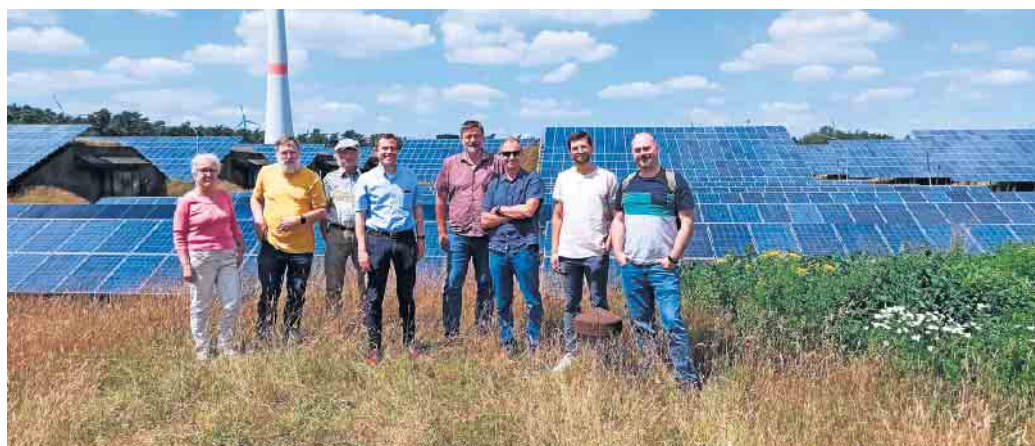
Eine Straelener Delegation besuchte die NRW-Klimakommune Saerbeck.